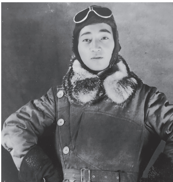
洲田美津雄海軍中佐