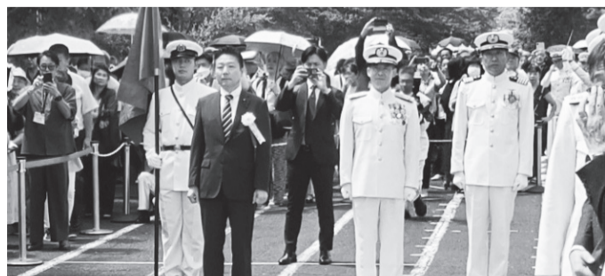
左から本田防衛副大臣、西脇総監、後藤教育隊司令