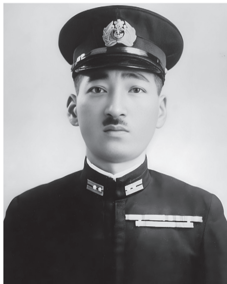
洲田美津雄海軍中佐

真珠湾への奇襲作戦は成功したが、この時米空母がいなかったのがその後の日本運命を変えた。洲田中佐はその後「南雲機動部隊」の南方作戦に従事し八