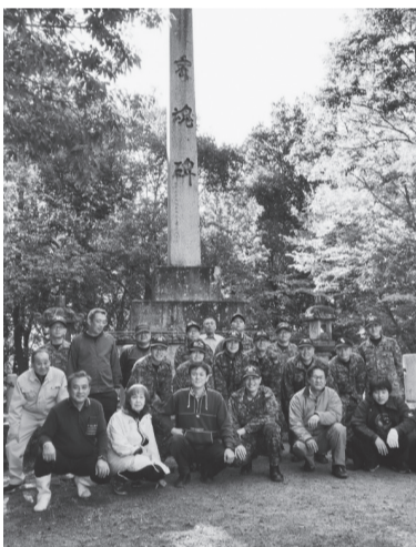
作業後に参加者で記念撮影

作業終了後、献花し全員で黙祷を行いました。作業しやすい天候で怪我・事故なく終える事が出来ました。(辻原健二)