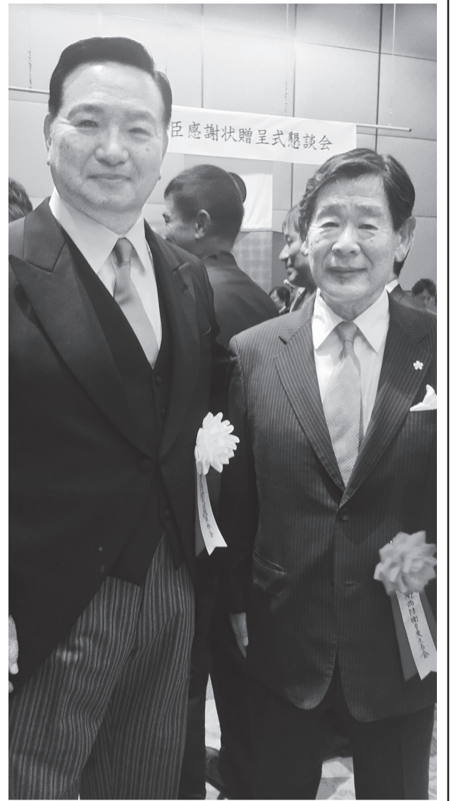
番匠防衛大臣参与