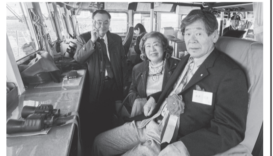
右から新井会長、喜連川常任理事、尾村会員