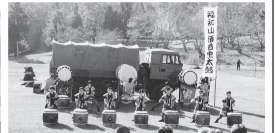
福知山酒呑鬼太鼓