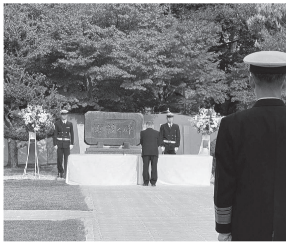
舞鶴地区殉職隊員追悼式 献花