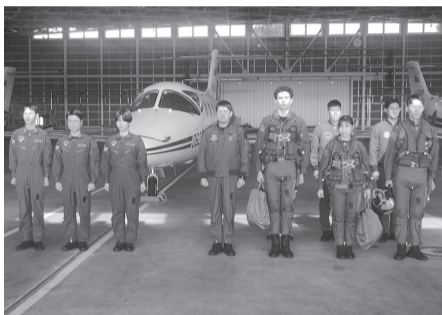
パイロットの卵たち