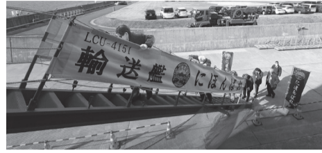
輸送艦「にほんばれ」