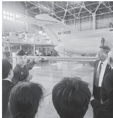
分かりやすい解説

多忙の中にもかかわらず丁寧で気持ちの良いご対応を賜り、隊員の皆様の人柄にも触れることができ、大変心温まる研修となりました。今後とも、どうかお身体に気を付けていただき、更なる活躍をお祈り申し上げます。