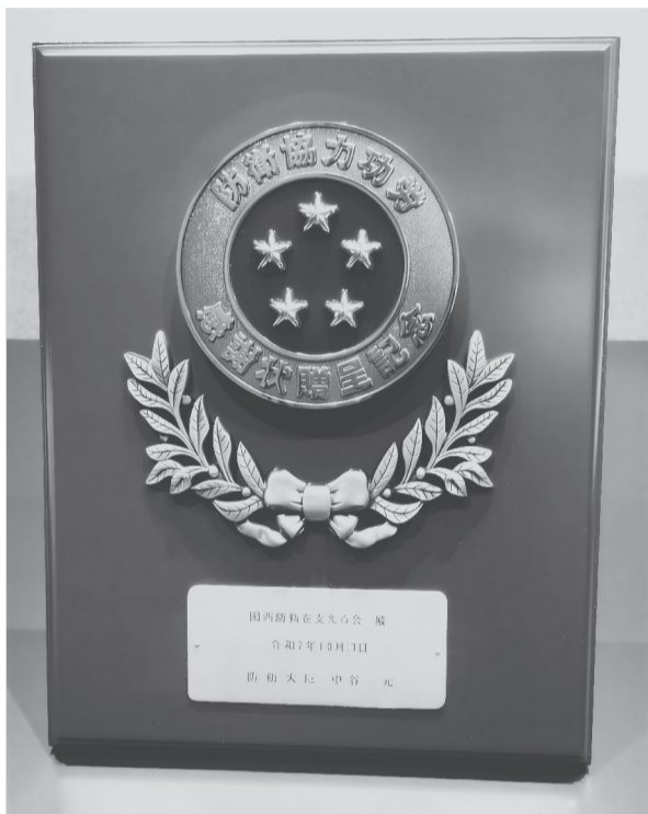
防衛大臣感謝状贈呈記念の楯