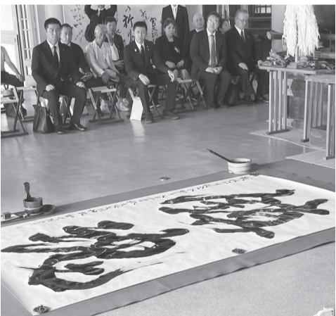
8月15日大阪護國神社に奉納された「鎮魂」の書