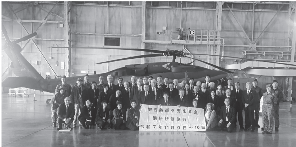
ヘリコプター前で記念撮影