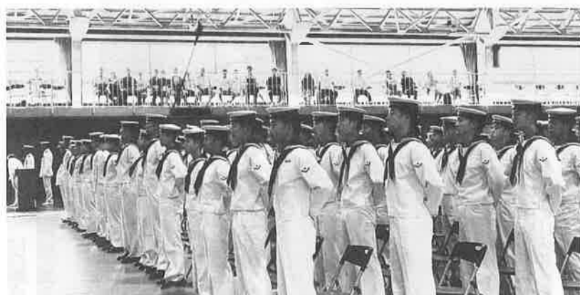
舞鶴教育隊修業式