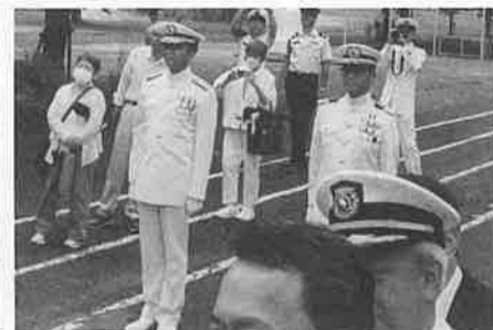
舞鶴教育隊修業式