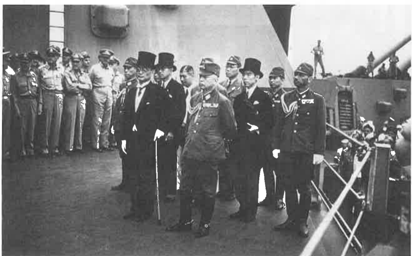
ミズーリ号調印式

が、杉田陸自幕僚長は自らと戸籍の原籍地である連隊に入学した。筆者であれば山口県が原籍なので「山口歩兵第42連隊」に入籍する。いわゆる郷士の連隊である。兵士は郷士の名譽のために、また郷土にいる父や母、家族のために戦った。今のウクライナの兵士も同じであろう。士気は極めて高い。陸自第37普通科連隊も、大楠公(楠木正成)の精神を引き継ぎ「菊水連隊」をトレードマークにして隊務に勤しんでいる。私も副署長時代行方不明者の捜索や松尾山の山火事の際大いに助けていただいた。これからも大阪南部・和歌山の郷士の防人として頑張っていたらいいと思っております。