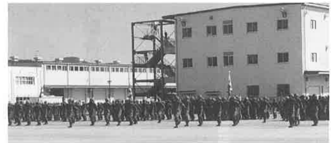
中部方面隊の隊員