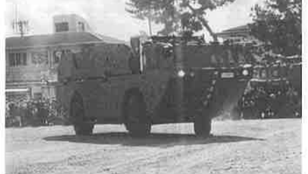
94式水際地雷敷設置装置