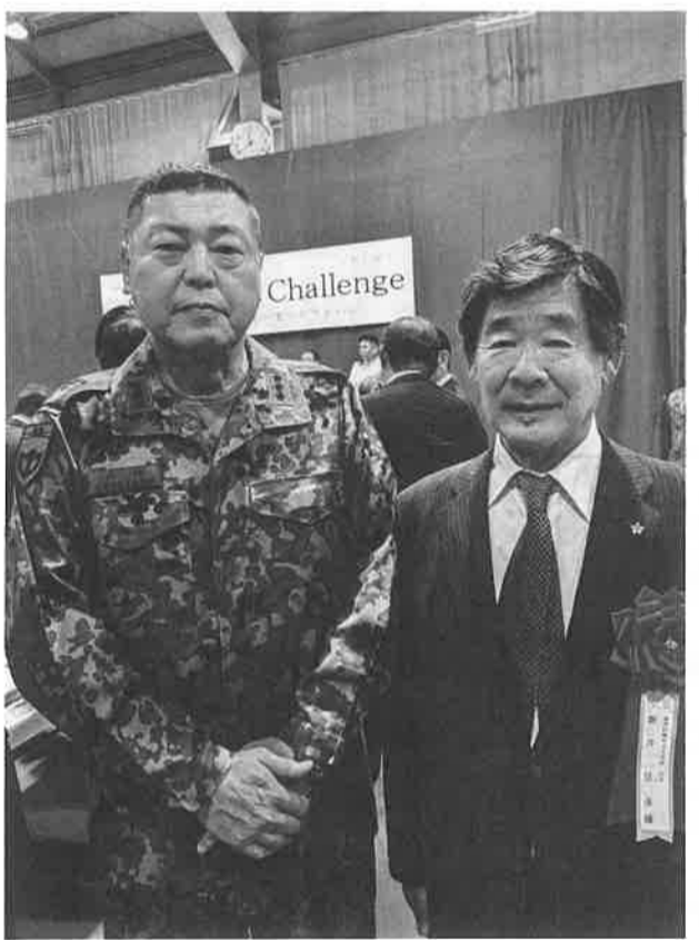
中部方面隊創隊64周年 小林弘樹総監(左)と

開催の年です。大阪から発信する未来都市が、明るい平和な世界へと発展し、全世界が幸多からん年となります。心からご祈念申し上げます。新年の挨拶とさせていただきます。