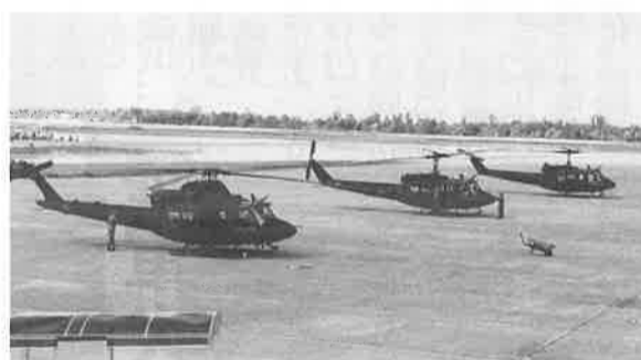
ヘリコプター部隊