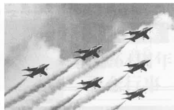
ブルーインパルスの飛行展示