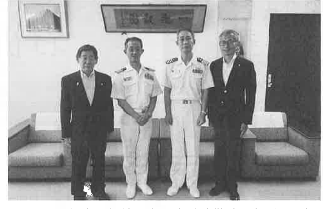
阪神基地隊桐生司令(左から2番目)表敬訪問(8月20日)

11月30日に開かれた阪神基地隊72周年記念行事に、「関西防衛を支える会」の代表として参加させていただきました。 掃海艇「あおしま」を見学させていただきました。国を守る自衛隊の皆様へ感謝と「ありがとうございます」の思いを美感謝した晴天の1日でした。 (高村明美)