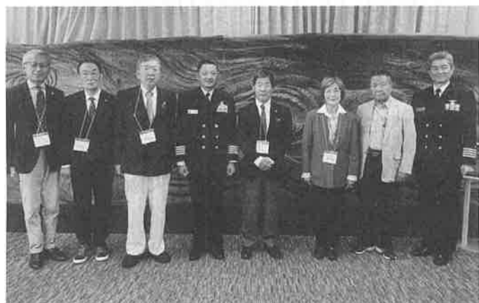
徳島教育航空群稲崎司令(左から4人目)と