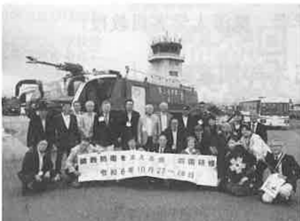
徳島基地で記念撮影