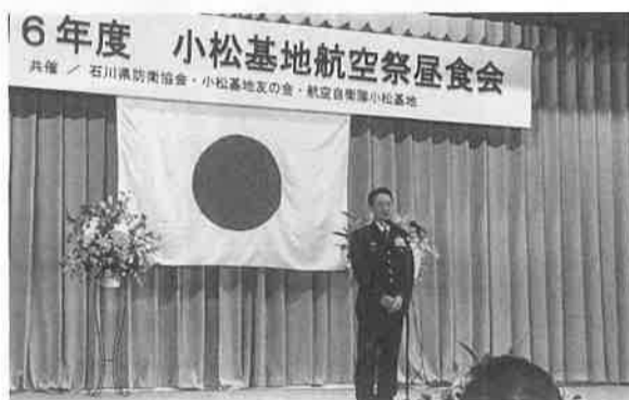
小松基地村上司令による挨拶