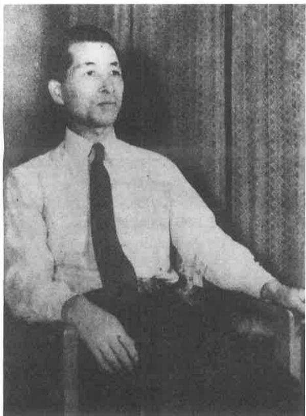
杉田一次陸軍大佐