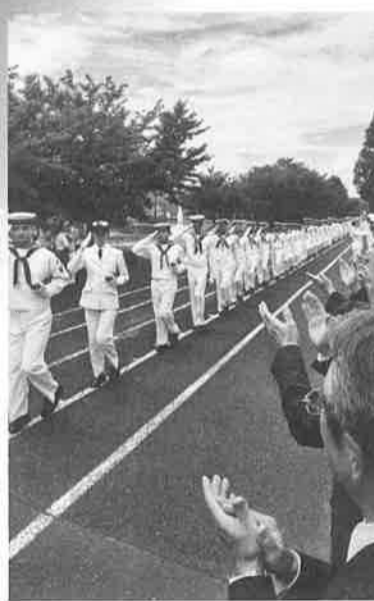
舞鶴教育隊修業式

8月25日、海上自衛隊舞鶴教育隊修業式に出席しました。就業者は196人(内女性29人、21年470人内女性41人)です。今回は日曜日の終業式でしたので、多くの家族が出席し、見送り行事に多くの方がお良かったと思えました。 入隊者の激減は由々しき問題だと改めて認識しました。関防会として自衛官募集活動への支援について検討・実施しなくてはならないのではと思いました。 (時岡利行)