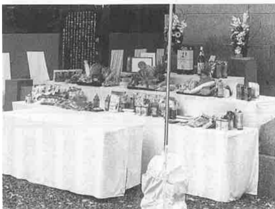
舞鶴地区殉職隊員追悼式