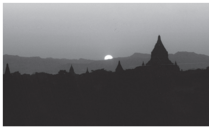
仏塔の浮ぶバガンの夕陽

であった王族を全て失う事となりました。また清廉な仏教徒であるビルマ人の町であったマンダレーは仏教徒のシンボル・バコダが次から次へと破壊され、モスクとキリスト教会が乱立する悲しむべき風景に変わっていきま