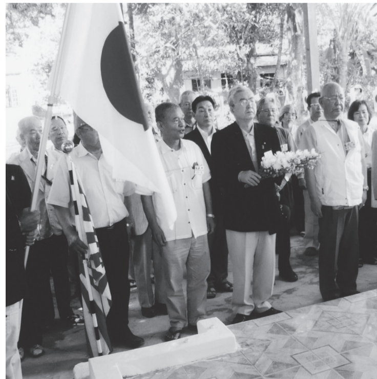
チュニカン僧院内の第56師団墓碑で献花する