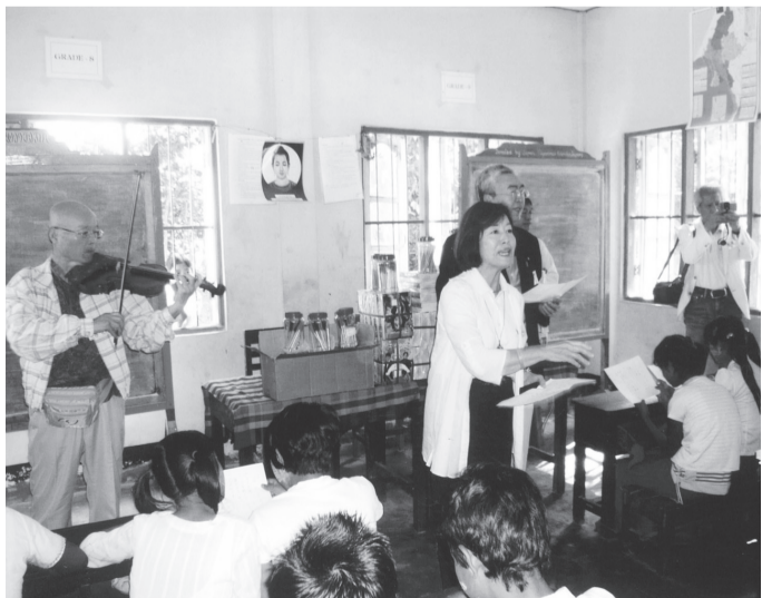
チュニカン小学校で童謡「故郷」を指導合唱する