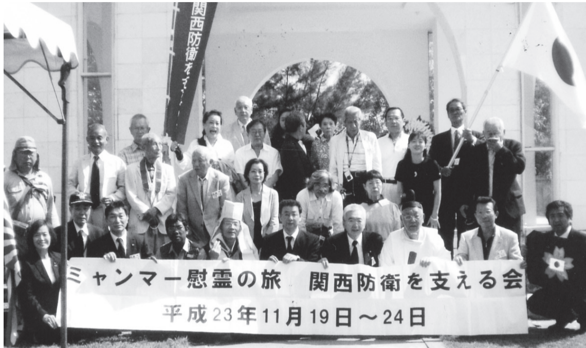
ミャンマー慰霊の旅 関西防衛を支える会 平成23年11月19日～24日

去年末の大阪市長、知事 選では大阪を掲げた大阪 維新が完勝した。大阪で は、民主党、自民党などの 既存政党に「ノー」を突き 付けた。石原慎太郎東京都 知事を党首に、東京、大阪 愛知を合わせた三大都市圏 の首長が連携する新党構想