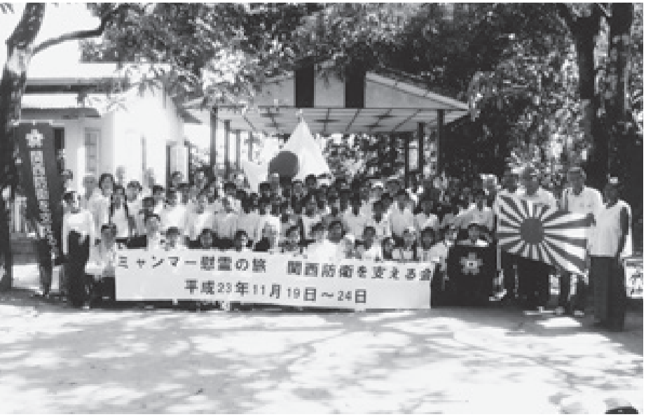
チュニカン僧院附属小学校の子供たちと