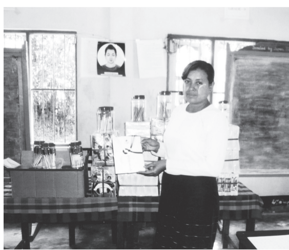
チュニカン小学校校長へ学用品 500 人分贈る