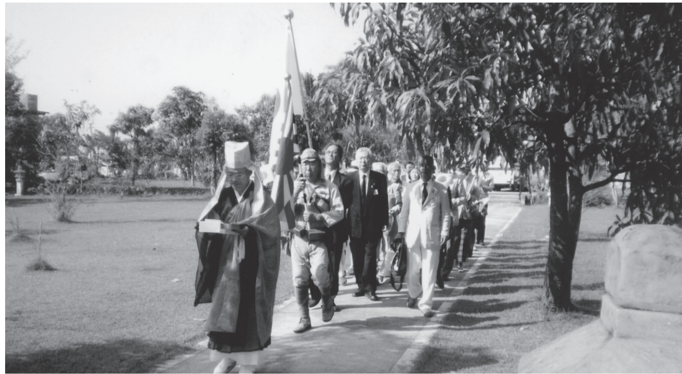
ヤンゴン郊外に建つ日本政府建立の慰霊碑へ行進する一行 (11月22日)

世間では一週遅れで競技場に入つて来たランナーは笑止千万ではあるが、海外三度目の慰霊に参加して、私は美に一世紀おくれの従軍僧なりと悟得するに至つたのである。