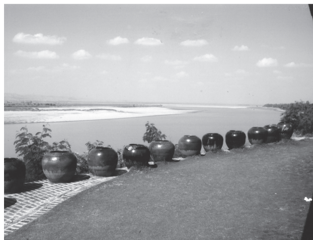
大河イラワジの川岸より上流の北西を望む(バガン)