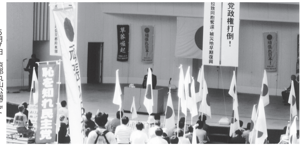
5月7日 京都丸山公園にて