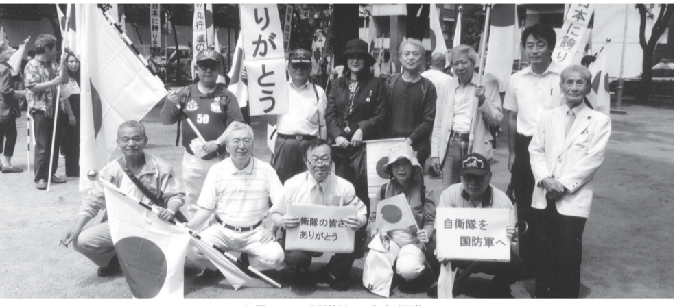
6月19日御堂筋日の丸行進