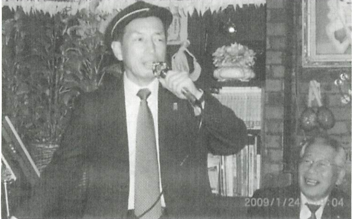
学生帽を被り「高校3年生」の替え歌を巧みに歌う田母神将軍