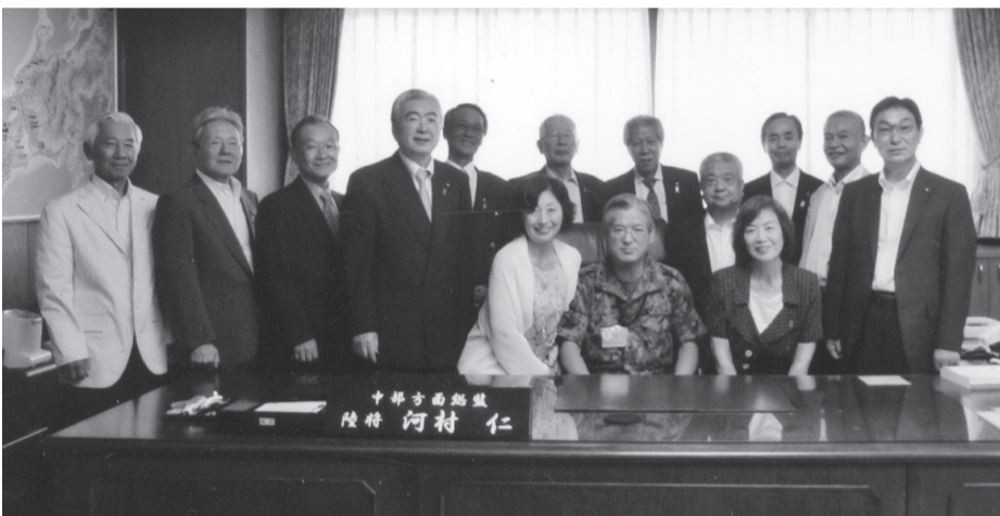
中部方面河村総監の夕食会に招待された関防会役員 (8月2日)

乗船者の70%が年配グループで30%が30才前後の人達だった。女性は看護婦薬剤師などの資格をもっている人が多かったが、問題は「若い男」。船上運動会や船上文化祭の主役となつてはしゃいでいたが、下船後どんな展望があるのか聞いてみたが、ほとんど何もなかった。世界一周の誘惑は麻薬作用と似ていて、自分のスキル向上に資する、と言った考へは聞かなかった。彼らの行く末が気になった。