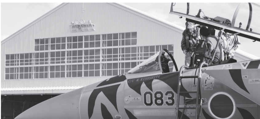
小松基地見学のときに見せてもらったF-15 戦闘機