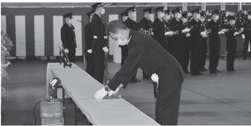
戦術教導団司令献花 (前小松基地司令)