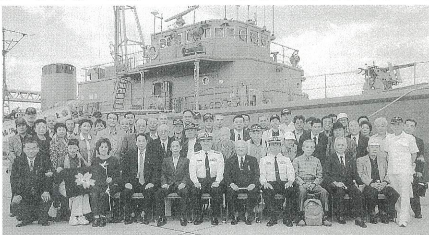
海上自衛隊はいつでも臨戦態勢