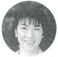
前経済産業副大臣 高市 早苗

衆議院で十年余、三期の任期を務めた後に落選した。投票日深夜に落選が確定した時、涙ぐむ支持者の前で口から出た言葉は、「私の力不足で負けちゃって、ゴメンなさい!」だけだった。必死で応援をして下さった方々への申し訳なさで胸が一杯だったからだが、敗戦の弁を取材に來たマスコミの方々が聞き出さずとしておられた「次回選挙への決意」については、何も申し上げなかった。