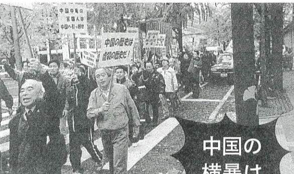
デモと抗議集会 平成15年11月30日