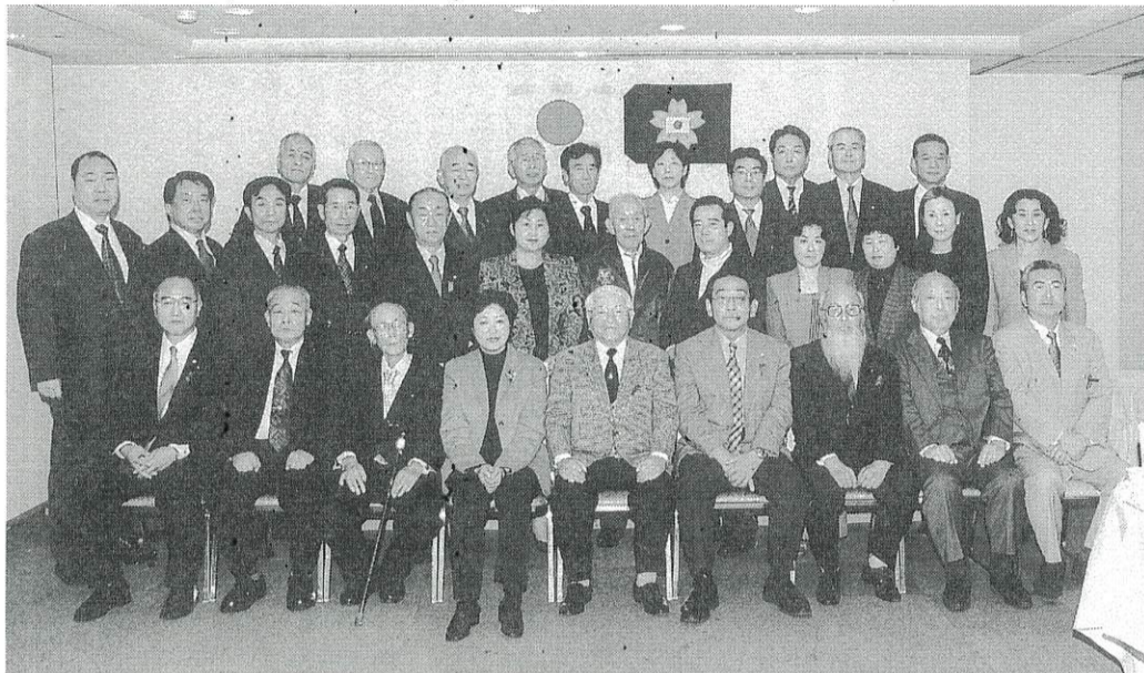
高橋会長を囲んで小池百合子環境大臣と西村真悟衆議院議員

平成16年1月1日(木) (皇紀2664年) (大正紀元93年) (昭和紀元79年)