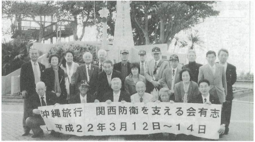
海軍戦没者慰霊の塔の前で

天候は、晴天・微風で、まるで本土の五月晴れのような天気です。我々を歓迎してくれているように感じられました。