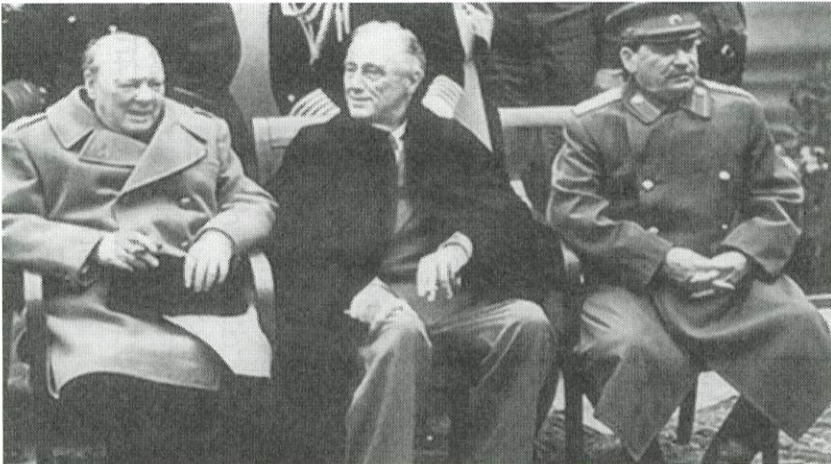
ヤルタ会談での英・米・ソの3首脳(左からチャーチル、ルーズベルト、スターリン)

考えていたのですが、しかし後年考えると大統領の演説会場に拳銃所持して潜入する事は当時でも不可能事ですから、文が易々と拳銃を持って会場に入れたのは不可思議です。政治的作為があったのでは、との疑念が拭