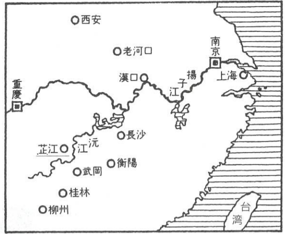
唯一の黒星・芷河作戦