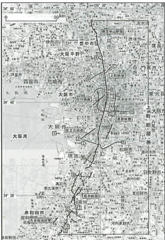
太線が大阪市内の活断層

本日、ご参加いただいた皆さんも、ご自分のお住まい周辺をもつ一度じっくりと見て、具体的な防災対策を他の住民の方々とよく協議されることを期待します。