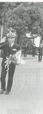
栄誉礼を受けて防衛庁を去る筆者