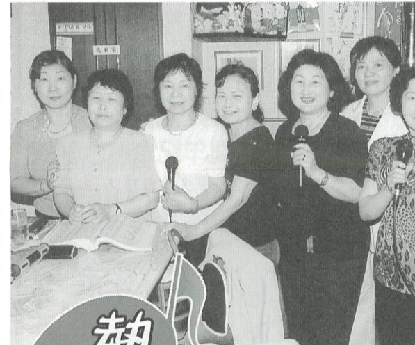
名曲「愛国の花」を熱唱する 関防会婦人部の精鋭 (5月29日)

自分の体温で冷えきった体を温め、助かった人々を、お寺や小学校に収容した。当時の村は電気・ガスはおろか水道もなく、水は雨水を利用していた。米も穫れず、島の人は貧しい生活を送っていたが、一生懸命に我が身を忘れて介抱した。村にある全ての物を提供し、大切にしている非常食用の日粮がある。 この遭難から九五年後、昭和六十年(一九八五年)の「紀伊民報」によると、トルコ軍艦エルトゥール号遭難の史実を全国に知ら 達には忘れていません。私も小学生のころ歴史教科書で学びました。トルコでは子供達に教え、エルトゥール号のことを知っています。今の日本人が知らないだけです。それでテヘランで困っている日本人を助けようとして、トルコ軍艦が飛んだのです。 町長は「大島住民の功績を全国に広め、後世に残したい。今年には『日本におけるトルコ年』であり、この盛り上がりを実現する絶好の機会」と、とらえ東京の出版社を訪問し小学校の道徳教科書に掲載されるよう依頼し、掲載の回答を得たようです。また、文部科学省も訪ね、かつてトルコ大使を勧められた遠山敦子大臣にエルトゥール号遭難が載った本を教科書に採用して貰うよう、協力要請している。串本町のこの取組は実に立派であり、絶大な支援を皆様と共に行っていきます。