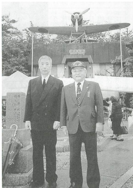
零戦のレプリカを背景に(左・神戸相談役、右・高橋会長)