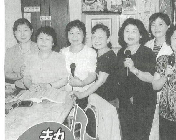
名曲「愛国の花」を熱唱する 関防会婦人部の精鋭 (5月29日)

明治二十三年(一九〇九年)九月二日、トルコの軍艦エルトゥール号が使用節団など六五〇名を乗せた日、日本での友好を深めた後、トルコに帰国の途中、串本町大島沖で台風の直撃を受け遭難した。乗組員などのうち五七八名が死亡し、生存者六九名という大惨事 に降ると、おびた。村の男達が岩場の海岸に降りると、おびた。村の男達が岩場の海岸に降りると、おびた。村の男達が岩場の海岸に降りると、おびた。 この遭難から九五年後、昭和六十年(一九八五年)日談がある。 「紀伊民報」によると、トルコ軍艦エルトゥール号遭難の史実を全国に知ら