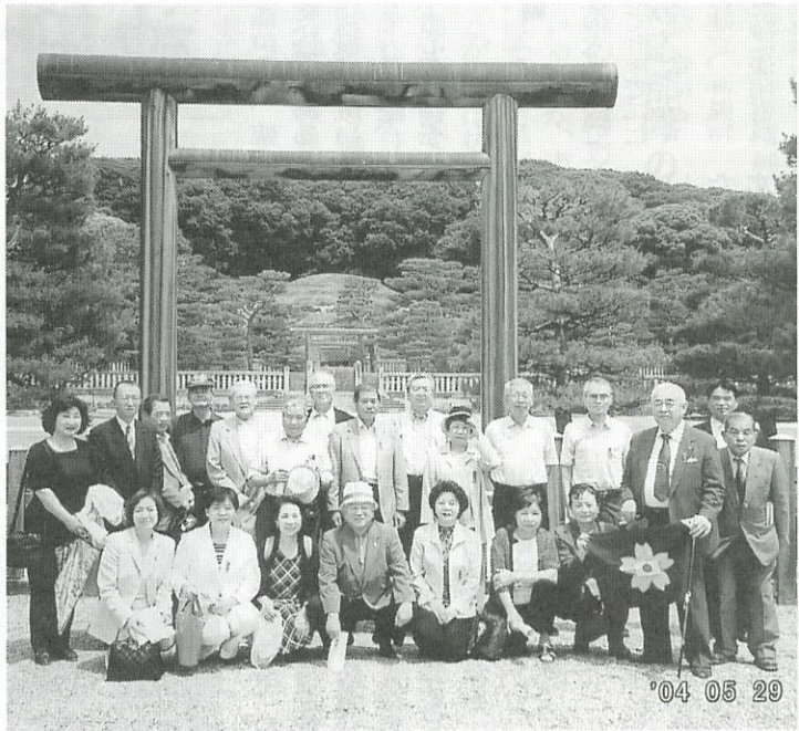
'04 05 29

平成十六年五月二十九日「関西防衛を支える会」の幹事諸兄の周到な計画のもと、日露開戦百周年行事として、桃山御陵と乃木神社参拝を実現できた事は感謝に堪えません。幸い天候にも恵まれ、二