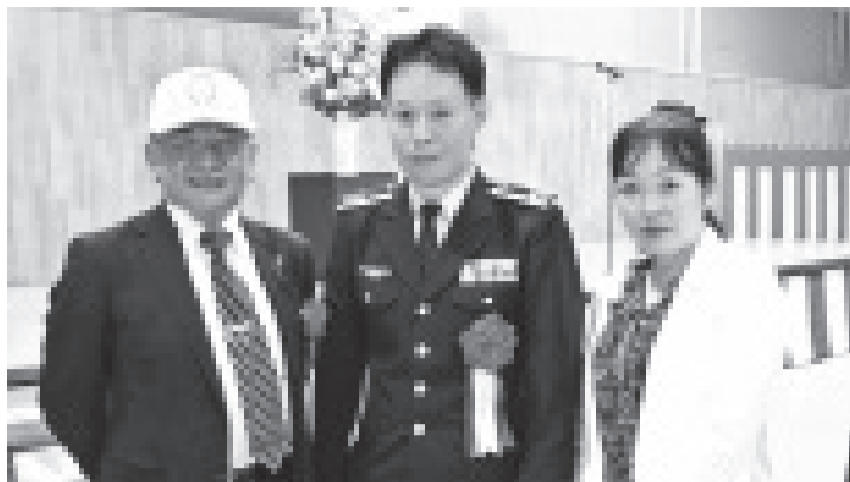
航空自衛隊白山分屯基地開庁46周年記念行事、関防会初参加 (7月7日)