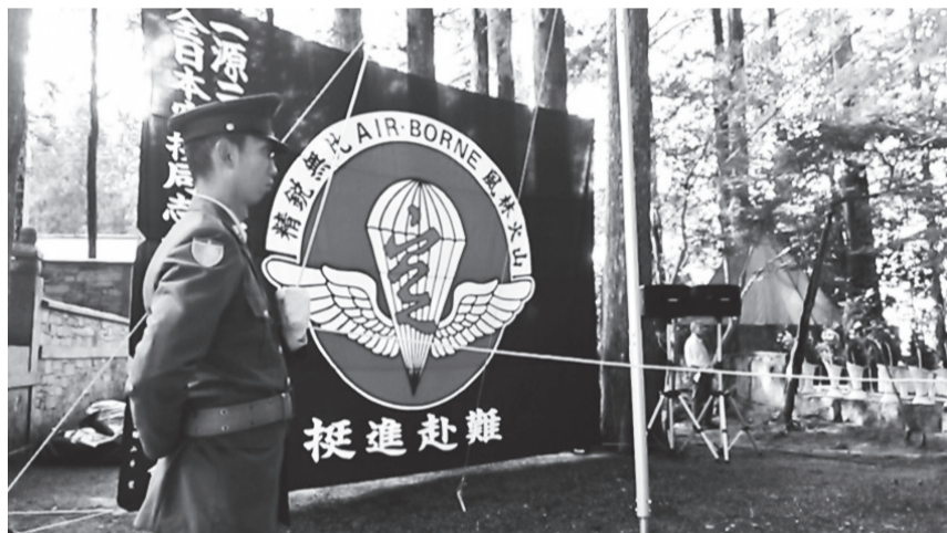
全日本空挺同志会高野山慰霊祭 (9月2日)