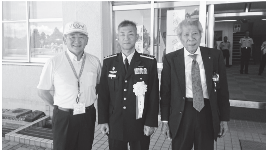
航空自衛隊笠取山分屯基地開設62周年記念行事オープンベース、関防会初参加 (7月22日)