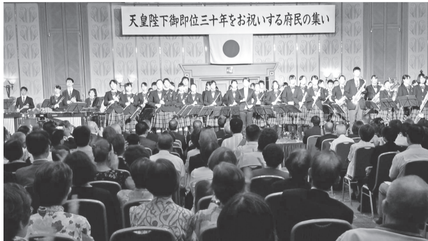
天皇陛下御即位30年をお祝いする府民の集い (8月18日)