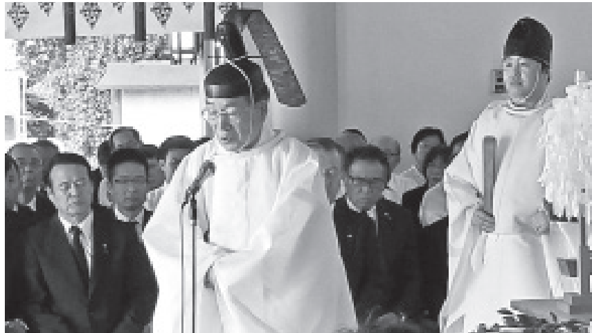
大阪護国神社英霊感謝祭 (8月15日)