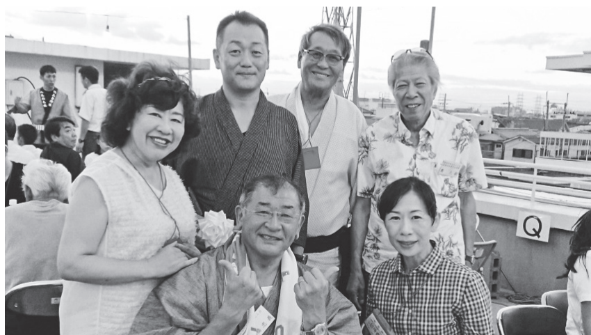
陸上自衛隊八尾駐屯地、盆踊り・花火大会 (8月8日)